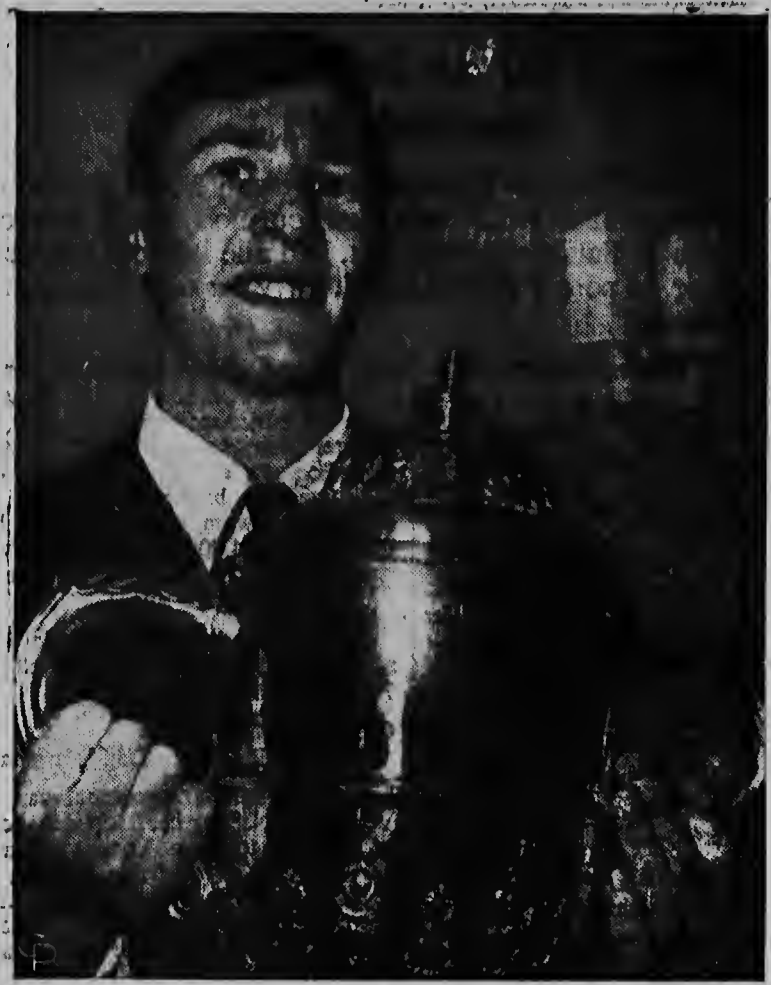
DR. ROGER BANNISTER, kende a conmové tur amante di deporte door di libra e record di 4 minuut pa un mill di carrera na 1954, aki ta tene den su mannan su trofeo pa e „SPORTSMAN DI ANJA”, na Londen.